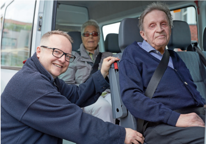
Einsteigen, bitte – zum Ausflug im Bus des Wohnheims.